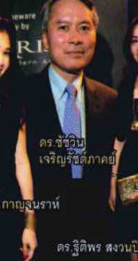
ดร.ชัชวรินทร์ เจริญรัชตภาคย์